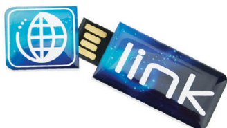
Verze s logoprintem