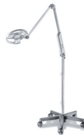
20-2 PTX + stojan pojízdný ND14.022.000