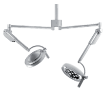
Duo 10/10 C